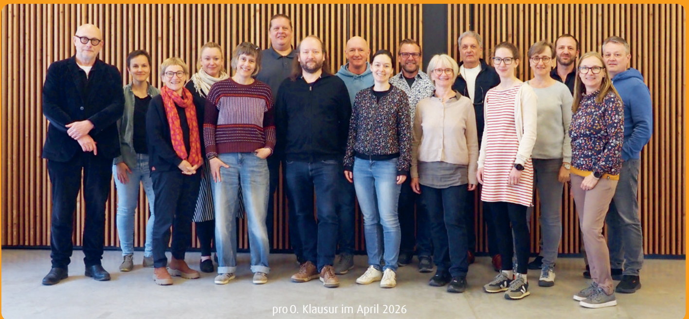
pro O. Klausur im April 2026

Wie jedes Jahr holen wir für Sie wieder Marillen! Der genaue Termin folgt, sobald die Marillen reif und köstlich sind.